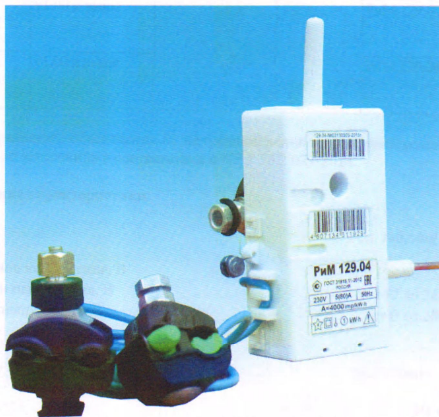
Рисунок 4 - Фотография общего вида и место установки пломбы поверителя счетчиков РИМ 129.04