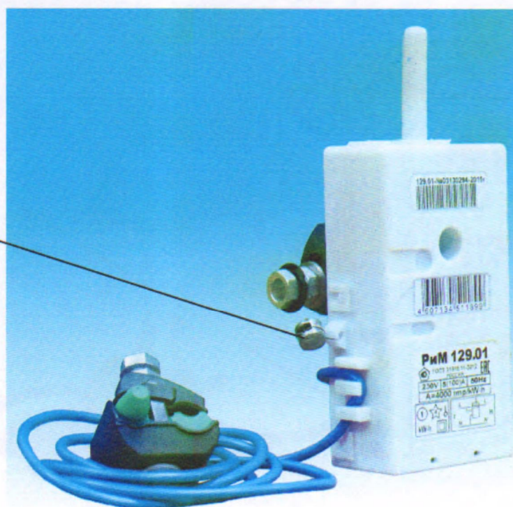
Рисунок 1 – Фотография общего вида и место установки пломбы поверителя счетчиков РИМ 129.01