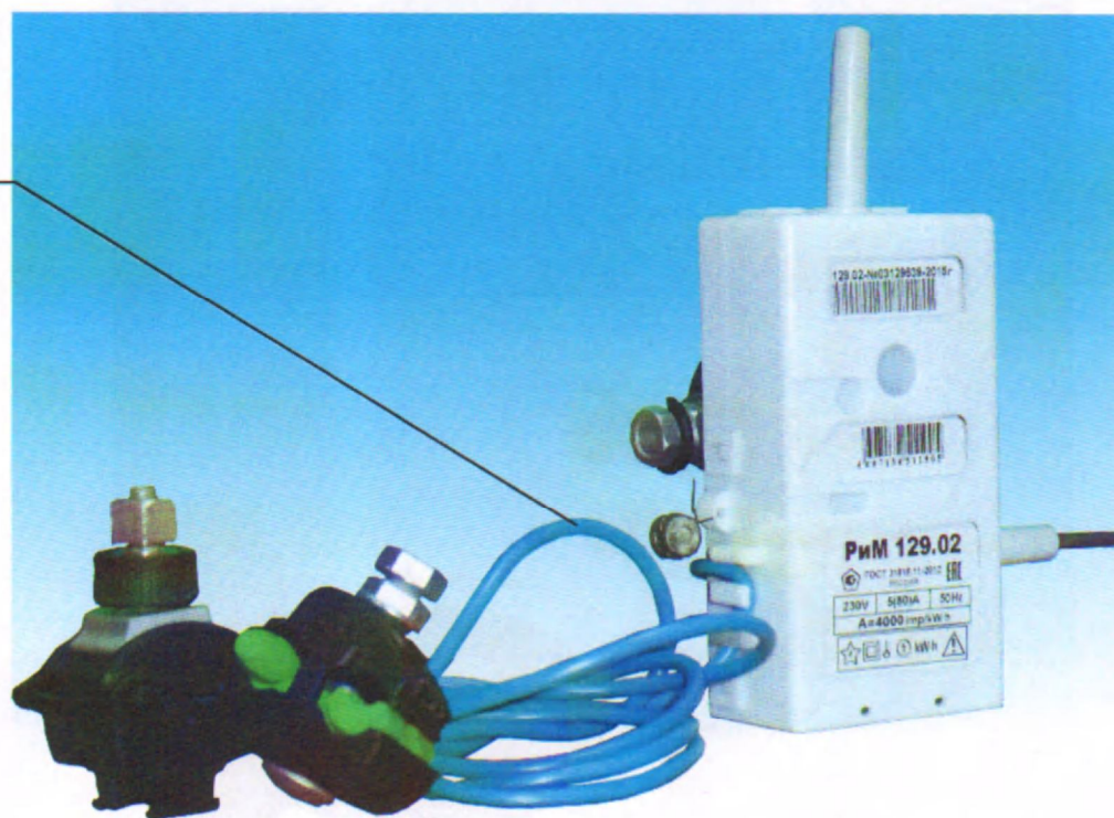
Рисунок 2 – Фотография общего вида и место установки пломбы поверителя счетчиков РИМ 129.02