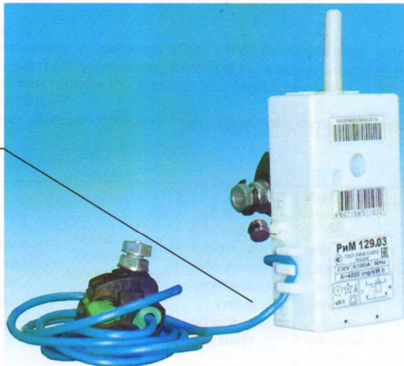
Рисунок 3 – Фотография общего вида и место установки пломбы поверителя счетчиков РИМ 129.03